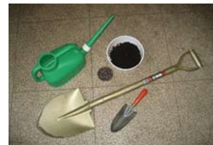
スコップなど 道具類