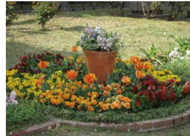
<4月の花壇の様子> パンジーにツマグロヒョウモンの幼虫が沢山います