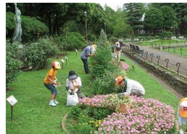
<8月初旬の様子> 花壇の1/6が餌 (丸い花壇の真ん中の三角のところ)