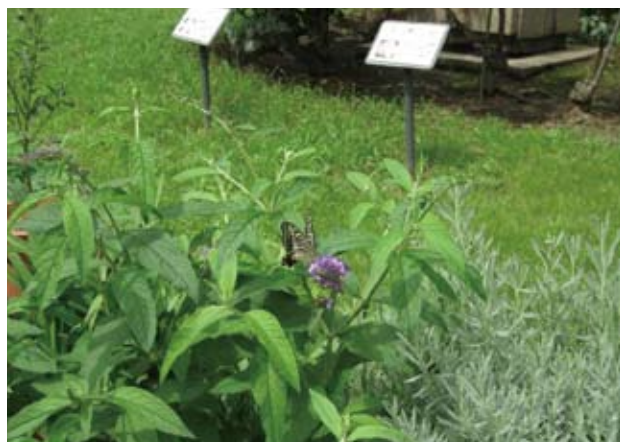
<8月初旬の様子> ブッドレアの蜜を吸うナミアゲハチョウ