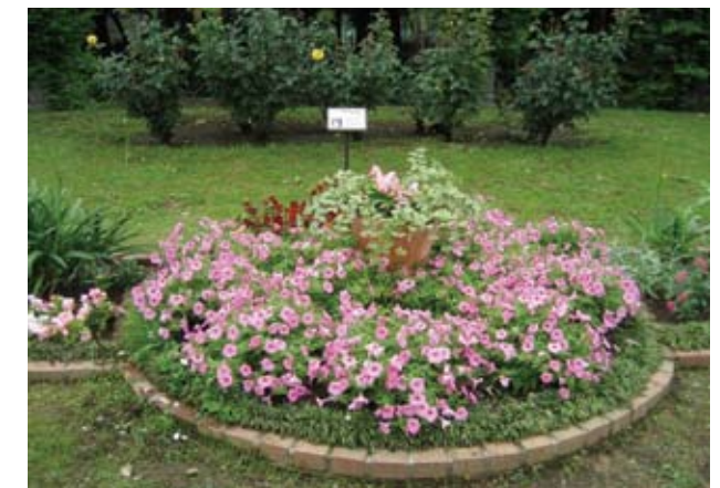
<7月初旬の様子> ペチュニアが大きくなりました。