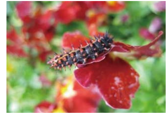
<4月の花壇の様子> ツマグロヒョウモンの幼虫