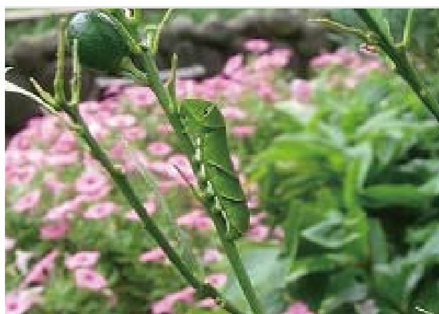
ナミアゲハの幼虫