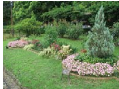
日比谷公園内花壇