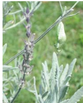
ナミアゲハのサナギ