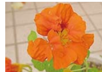
ナスターチュウム