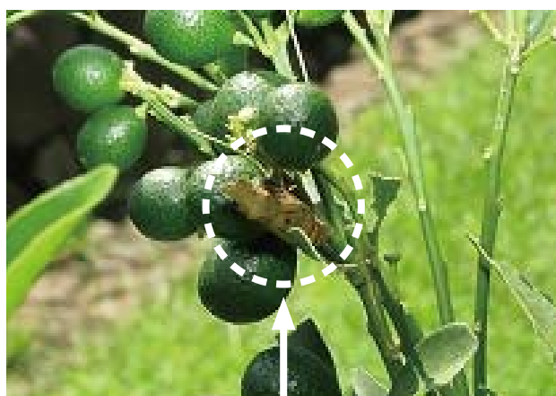
キンカンの幹についた、ナミアゲハのサナギのぬけがら