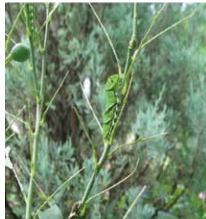
ナミアゲハの幼虫