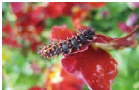
シマクロヒョウモンの幼虫