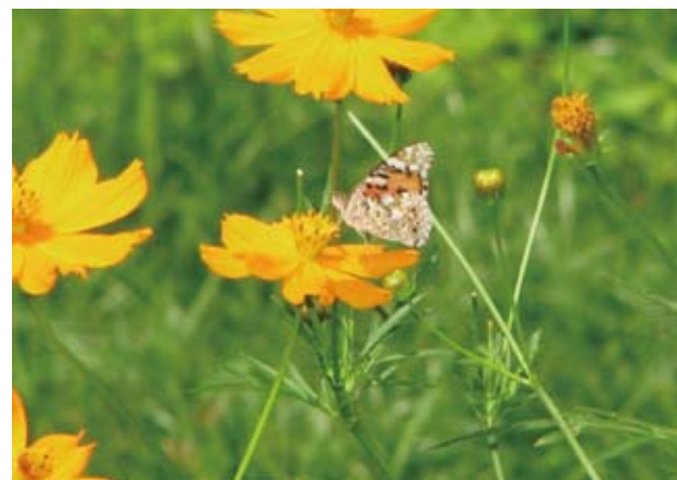
<8月初旬の様子> キバナコスモスの蜜をすうツマグロヒョウモン