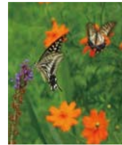
黄花コスモスの蜜を吸う ナミアゲハチョウ