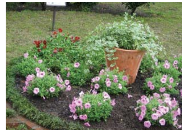
<5月に花苗植え替え時の様子> パンジーからペチュニアに植え替えました。 少し後ろにパンジーを残してあります。