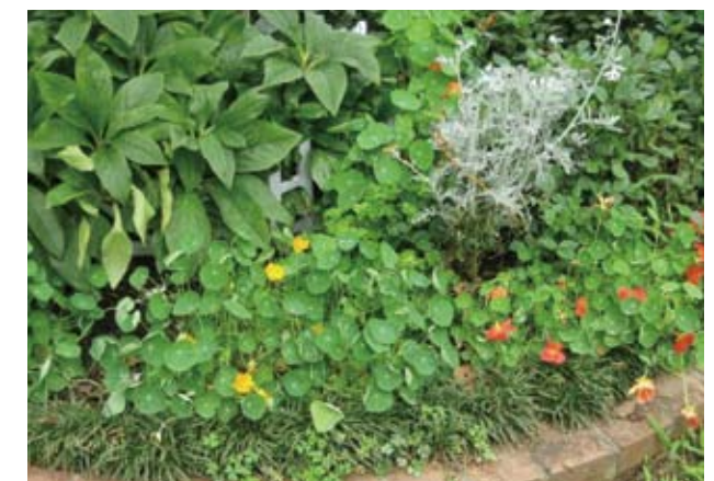
<8月頃の様子> パンジーが終わった後にナスタチューム、バセリ、黄花コスモスを植えました。